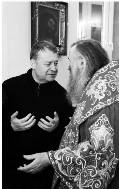
Воскресе!" архиепископ Иоанн приветствовал всех прихожан.

Торжественное богослужение возглавил архиепископ Йошкар-Олинский и Марийский Иоанн. Заутреня началась в 23:30. Ровно в полночь священнослужители и прихожане под звон колоколов прошли Крестным ходом вокруг собора, после чего словами "Христос